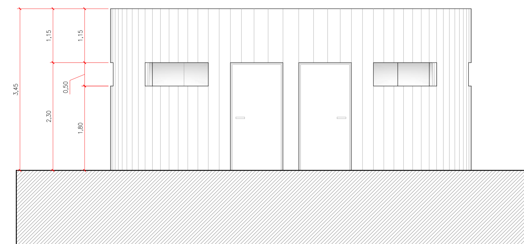
ELEVÇÃO 01 ESCALA 1: 50