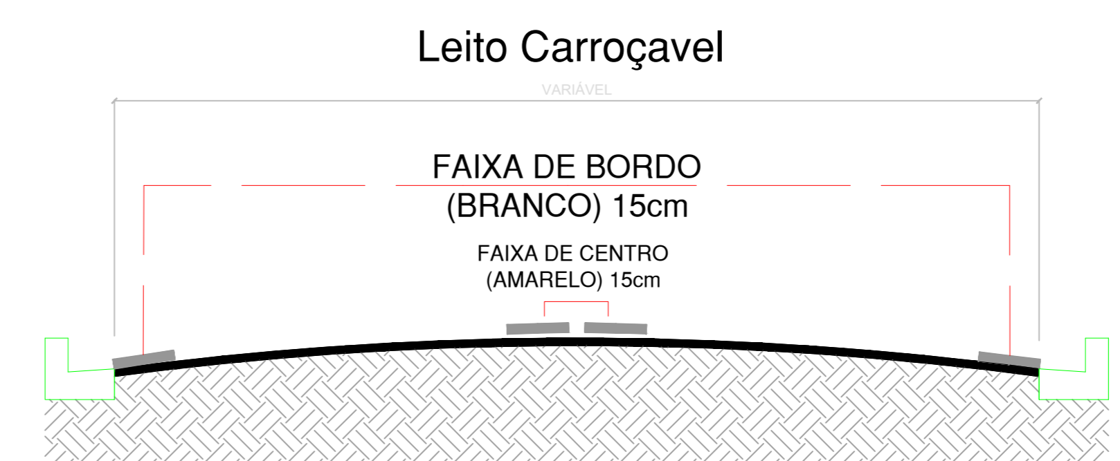
DETALHE SINALIZAÇÃO HORIZONTAL VIÁRIA FAIXA DE CENTRO E DE BORDO

INDICAÇÃO DE SINALIZAÇÃO HORIZONTAL EM TRECHOS COM E SEM ACOSTAMENTO SEM ESCALA